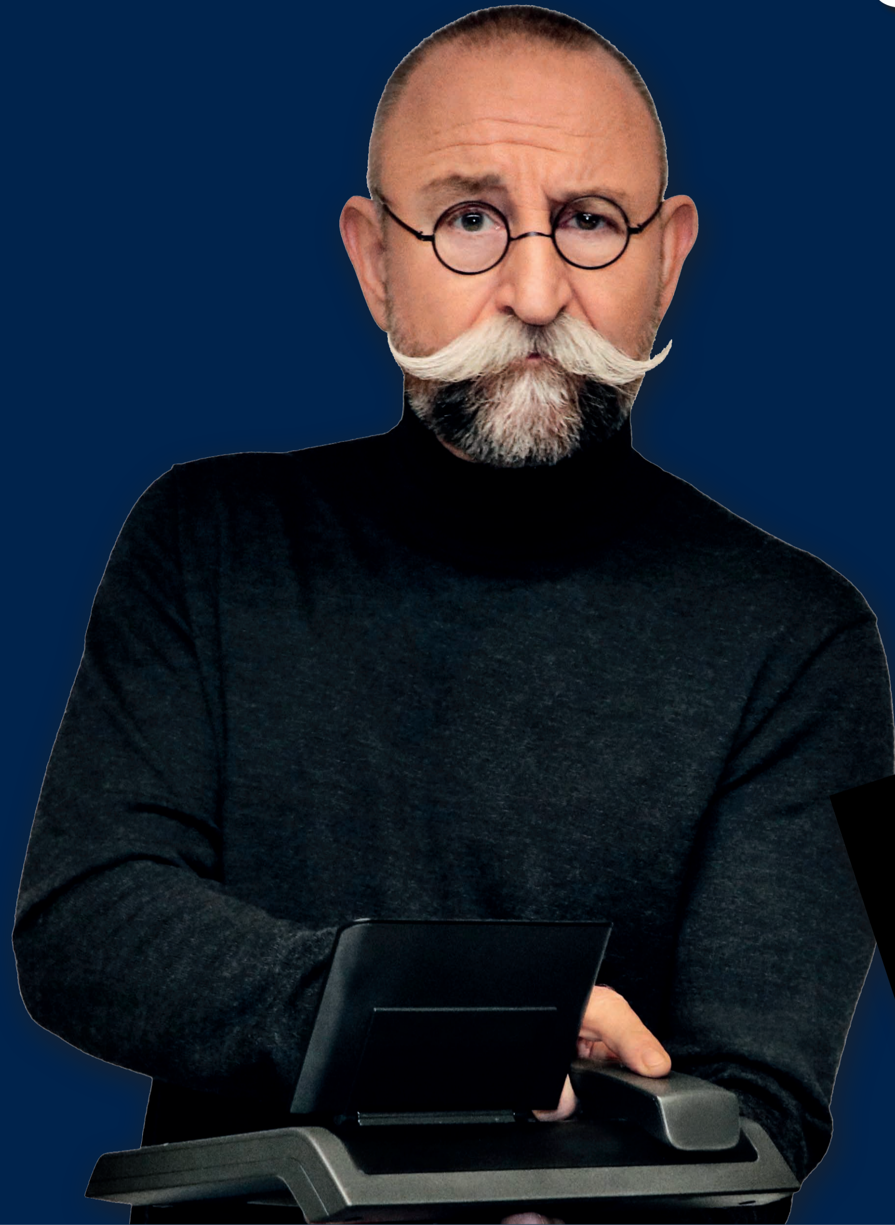
Horst Lichter TV Moderator