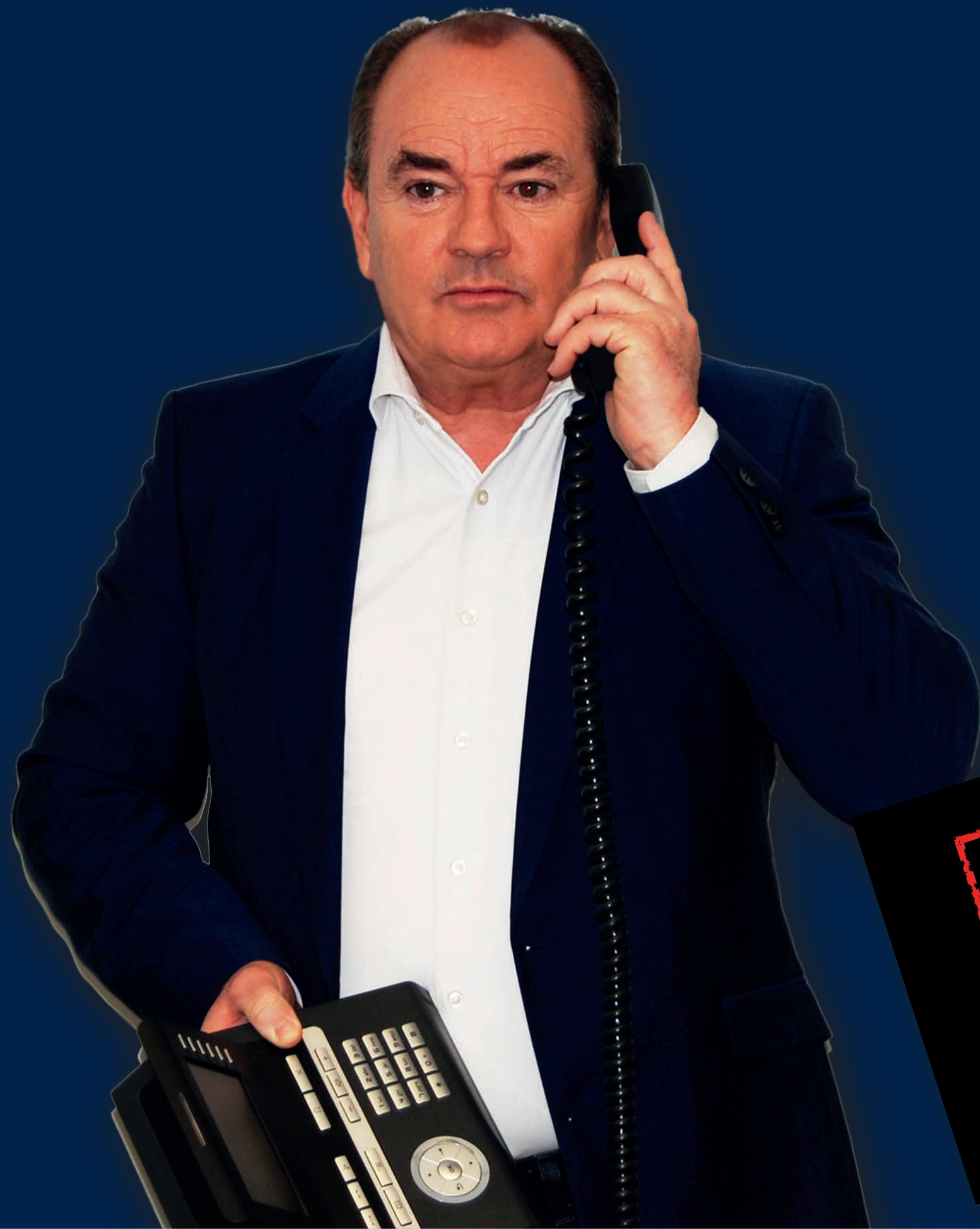
Wolfram Kons TV-Moderator