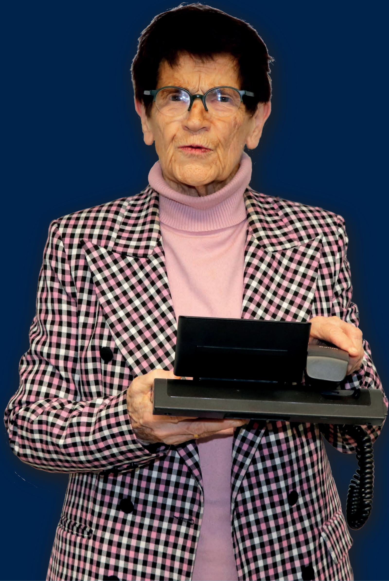
Rita Süßmuth Bundestagspräsidentin a.D.