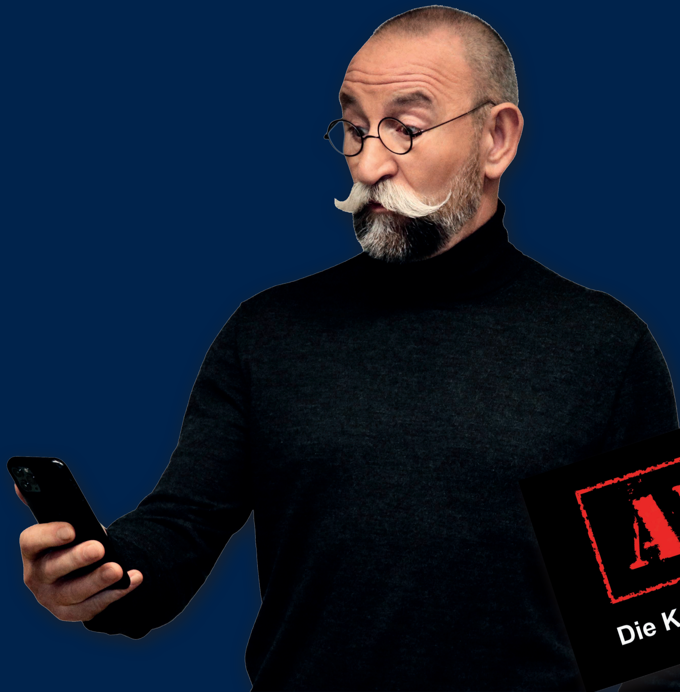
Horst Lichter TV Moderator