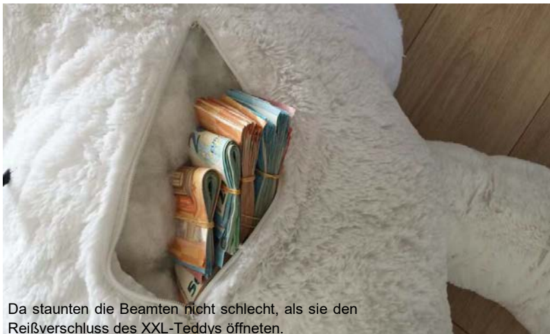
Da staunten die Beamten nicht schlecht, als sie den Reißverschluss des XXL-Teddys öffneten.