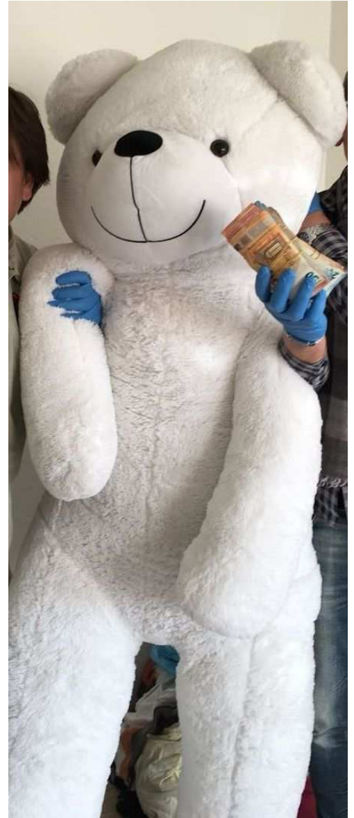
Der Teddy war sehr auffällig und fast so groß wie die Polizisten selbst.

Im ersten Fall hat das Kriminalkommissariat 13 ein Rauschgiftermittlungsverfahren geführt, bei dem unter anderem 75 Kilogramm Marihuana in einer Garage aufgefunden worden sind. In der Wohnung des Tatverdächtigen stießen die Ermittler auf einen besonderen Blickfang: Einen XXL-Teddybären, der so groß war, wie die Polizisten selbst. Der Rücken wies einen Clou auf. Hier befand sich ein Reißverschluss mit einem kostbaren Versteck: Insgesamt 10.700 Euro Deal-Geld waren darin deponiert worden.