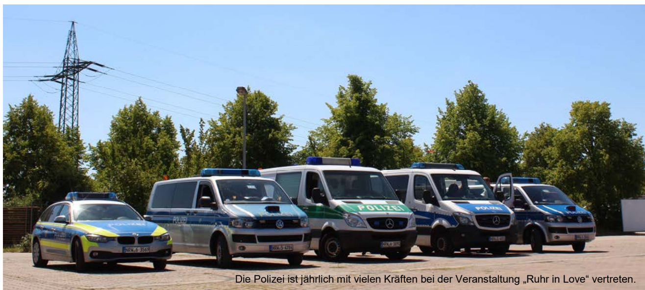
Die Polizei ist jährlich mit vielen Kräften bei der Veranstaltung „Ruhr in Love“ vertreten.