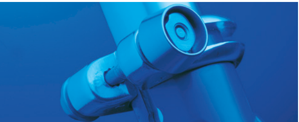
^ Codierte Verschraubung

Als Alternative bietet der Fahrradhandel vereinzelt aber auch bereits elektronische Kennzeichnungen an, bei denen ein Mikrochip im Fahrradrahmen die wesentlichen Daten des Fahrrades und des Eigentümers enthält.