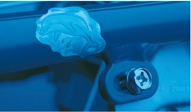
^ Individuelles Kennzeichen am Fahrradrahmen

An Orten, wo Fahrräder nicht auf diese Weise codiert werden, sollten Sie in jedem Fall ein eigenes individuelles Kennzeichen anbringen. Wie unser Beispiel zeigt, empfehlen sich dazu etwa „unvergessliche“ Daten wie das eigene Kfz-Kennzeichen, das eigene Geburtsdatum und die Initialen des eigenen Namens.